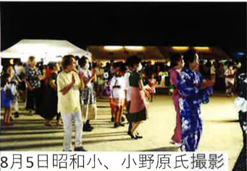
8月5日昭和小学