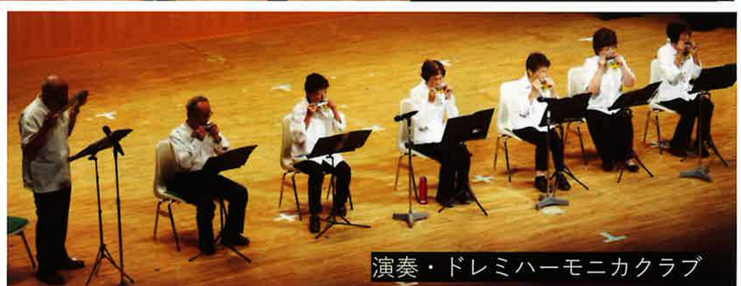
演奏・ドレミハーモニカクラブ