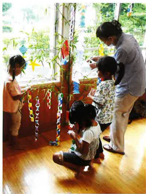
6月27日、園児23名とシニア20名で作りました。

は、シニアクラブと七夕飾りを作りました。シニアは園児の歓迎を受け、会話を楽しみ、一緒に楽しいひと時を過ごしました。