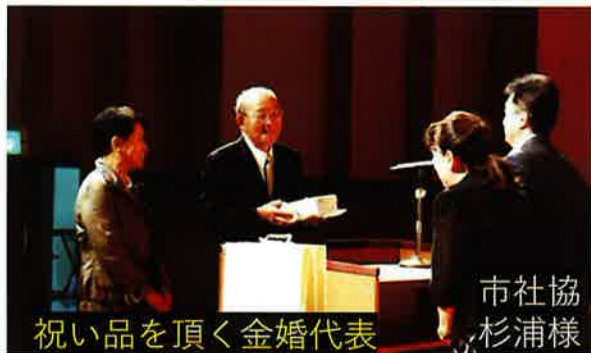
祝い品を頂く金婚代表