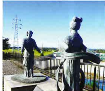
日本武尊と弟橘媛の像 木更津大橋(国道410)

日本武尊は大和王権がその勢力を広げる時代に、従わない地方豪族を征伐しています。鹿野山一帯を支配していた阿久留(あくる)王との戦いが東征の目的とも云われています。