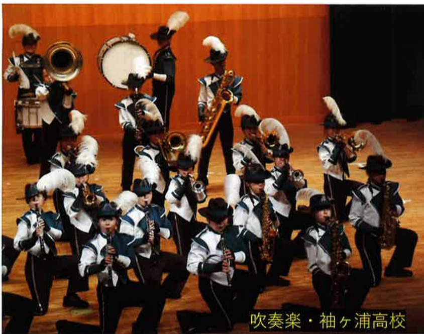
吹奏楽・袖ヶ浦高校