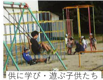
供に学び・遊ぶ子供たち