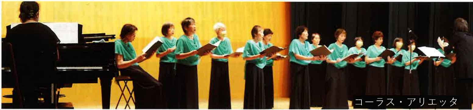
コーラス・アリエッタ