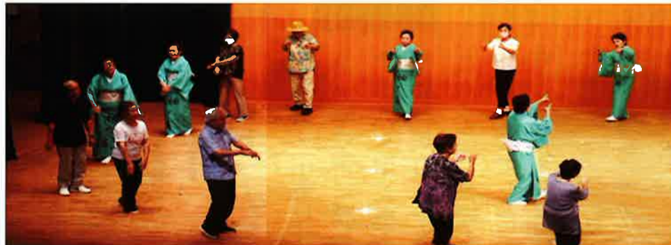
舞踊・みんなで袖ヶ浦音頭II