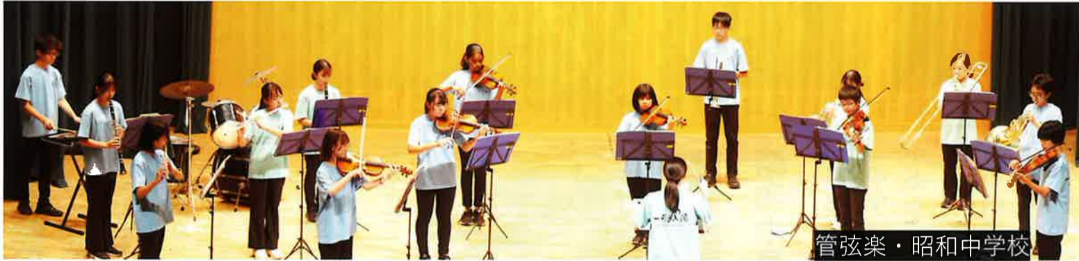
管弦楽・昭和中学校