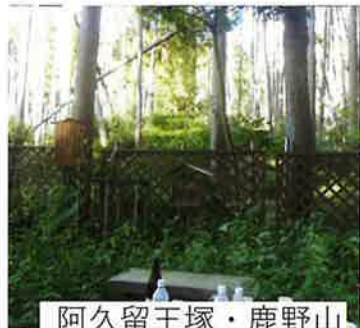
阿久留王塚・鹿野山