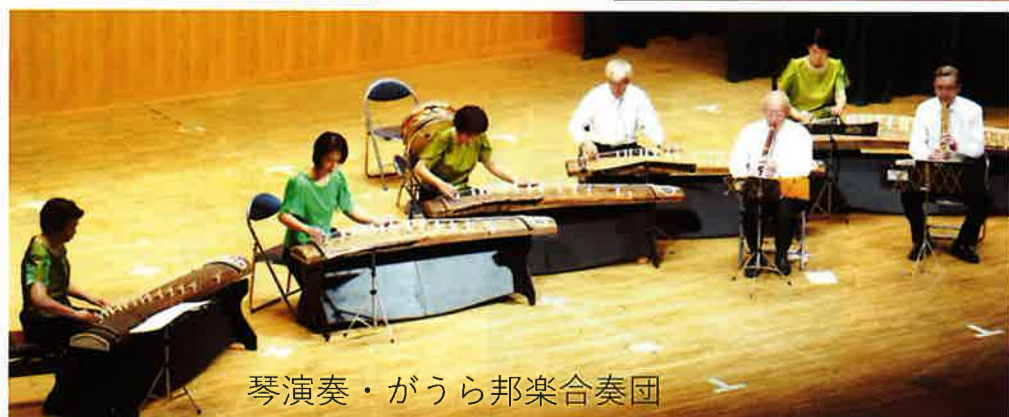
琴演奏・がうら邦楽合奏団