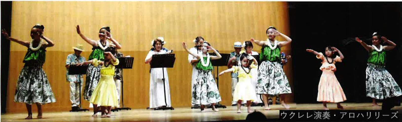
ウクレレ演奏・アロハリリーズ