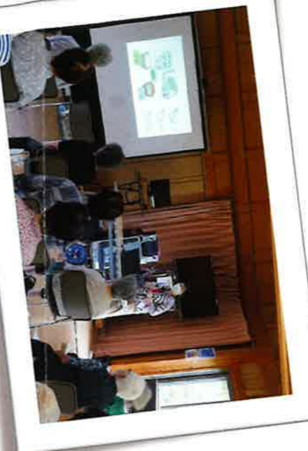
6/28 浜宿団地サロン 管理栄養士の話