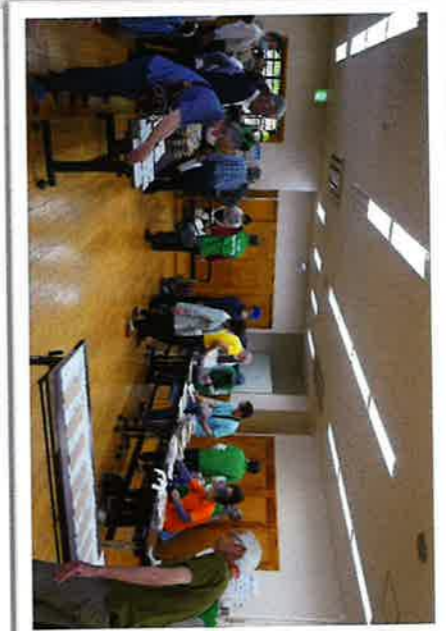
配布迄の準備作業

「物品、資料」をお届けしながら 見回り先での体調や暮らしぶりを 確認しています。 皆さん、元気？