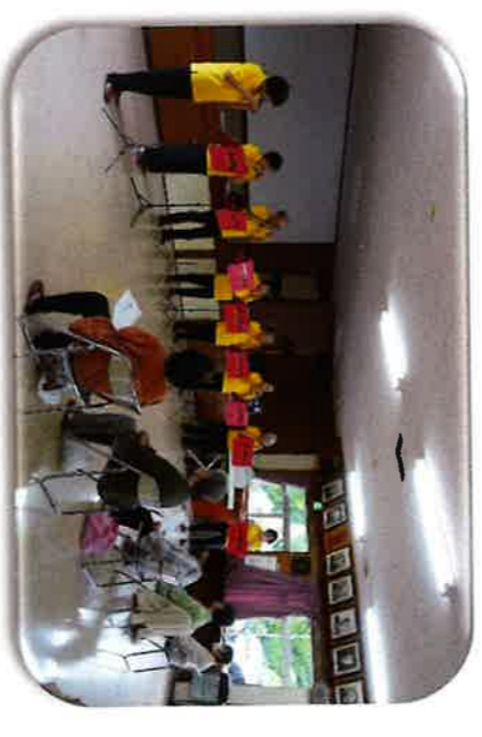
7/6 代宿サロン オカリナの演奏と合唱