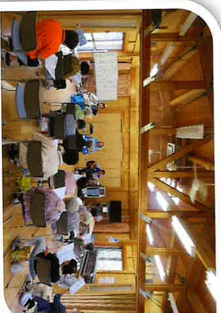
9/7 浜宿団地サロン ひこうき雲の演奏と合唱