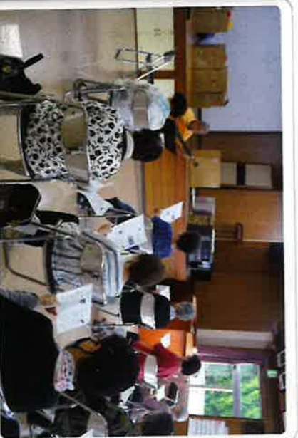
9/14 代宿サロン ギター演奏