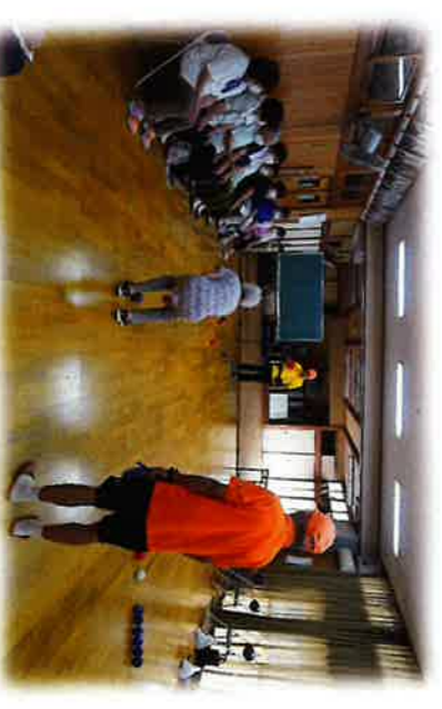
8/10 久保田サロン ボウチヤゲーム