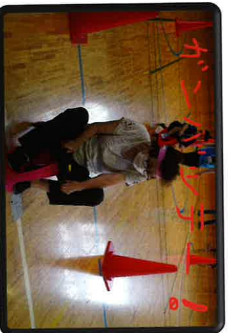
7/21 長浦駅前サロン 長浦小 なごやか交流会とコラボ