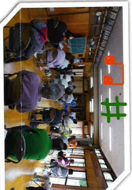
5/25 久保田サロン ひこうき雲の演奏と合唱

是非遊びに来てください 長浦地区 4 か所で合計 5 回(年) 開催しています。予定は、逐次チラシ、 便り等でお知らせします。