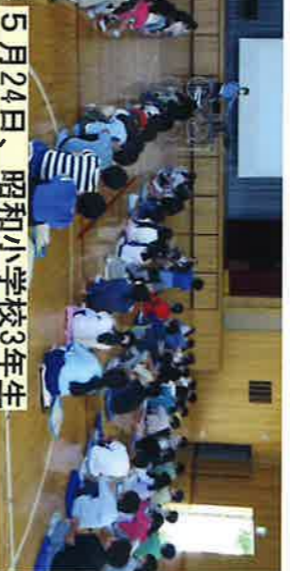
5月24日、昭和小学校3年生