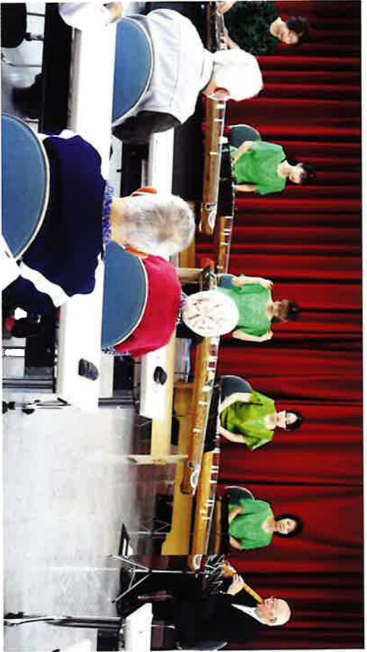
「和楽器演奏」 おこと楽坊、三曲睦会

中山地区社協会長の「ようやく」に飲食ができるお楽しみ昼食会を開催できました」の挨拶に始まり、演奏を聴き、一緒に歌い出し、参加した人からは一緒に食事するのは楽しいですねとあります。