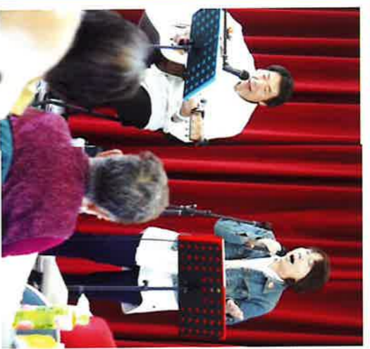
「ギター演奏と歌」 エスアソビエム