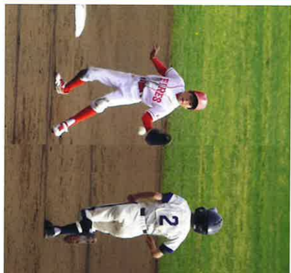
昭和少年野球クラブ(攻撃)と福玉台フライヤーズ(守備)の試合

昭和地区には上記少年野球3チームがあり、4月2日春季大会で頑張っている子供たちです。