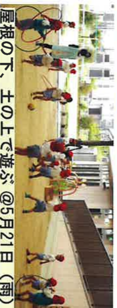
屋根の下、土の上で遊ぶ@5月21日(雨)