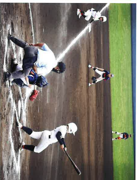
神納フレンズは攻撃中

子供たちは、WBCの日本チームがみんな で応援する姿をみて、自分たちも助け合っ て強くなりたいと言っていました。