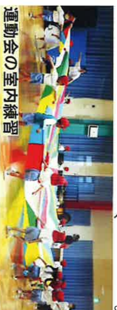
運動会の室内練習

(島海園長)。 0歳〜5歳 までの子供の 多い園ですが、 広い保育室、 多くの遊び場 と共に、園見 の元気な挨拶 が印象に残り ました。