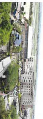
率土神社南古墳(帆立貝式前方 後円墳)横からの眺め