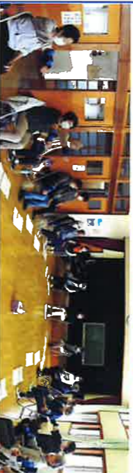
奈良 奈良 毎水曜、百歳体操を会員24名が、4月19日撮影 輪会館で行っています。