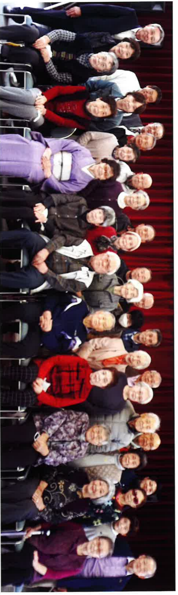
参加頂いた31名と準備された昭和地区社協の事業推進員の皆様です