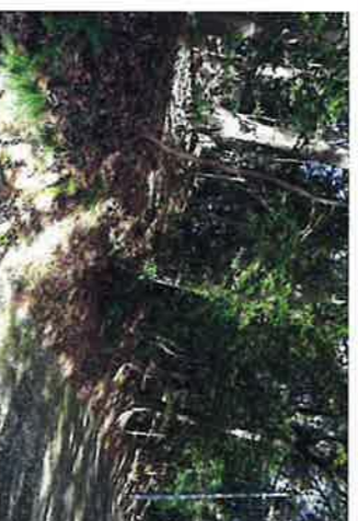
坂戸神社参道横に坂戸神社古墳

古墳時代(三世紀後半から七世紀の終り)に、 富と権力を持った統率者の墓を、集落を見 下ろす山頂や丘陵上に作ったのが古墳です。 中でも前方後円墳は大和王権に忠誠を誓う 地方の豪族だけが許されており、当地には 坂戸神社古墳があり、豊かで、中央との結 びつきが強かった土地と云えます。