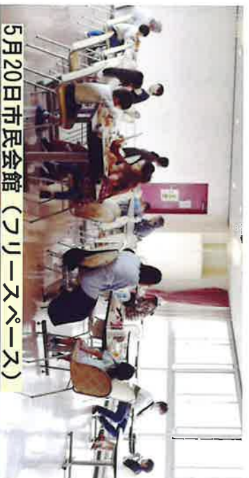
5月20日市民会館(コリンスペース)

広く、明るい場所で の食事会は和やかな 雰囲気です、参加頂い た方から「多くの入 と一緒に食事ができ、 楽しいです」「ここ での食事は助かりま す」とありました。