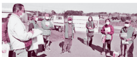
▲令和3年1月の見守りの際の様子 民生委員児童委員12名で集まり、各地区に分かれ、ご利用者宅を訪問しています。

対象:満75歳以上おひとり暮らしの方 満80歳以上のご夫婦世帯(夫婦ともに満80歳以上)のいずれかで月1回の見守りを希望される方