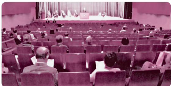
～令和3年度袖ヶ浦市民生委員児童委員協議会総会～ 令和2年度総会は緊急事態宣言により書面開催となりましたが、令和3年度は感染予防対策をとり開催できました。