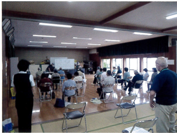
① 7月14日 長浦駅前自治会館 さつき台病院副院長の講話