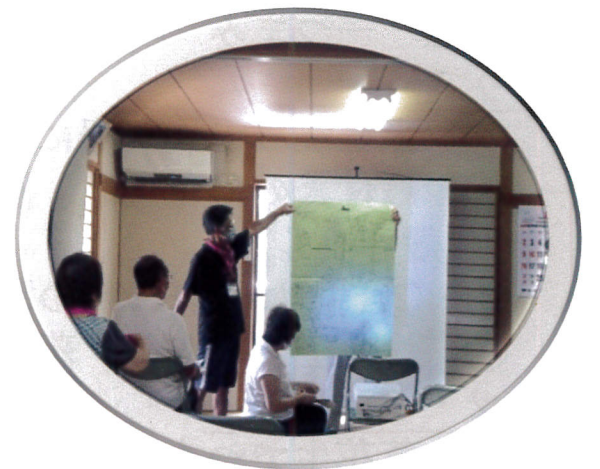
③ 8月6日 久保田多目的会館 薬剤師の講話

* 上記以外に ④ 8月7日 久保田多目的会館、⑤ 8月25日 浜宿自治会館、⑥ 9月8日 代宿公民館 ⑦ 9月24日 久保田多目的会館で開催しました。