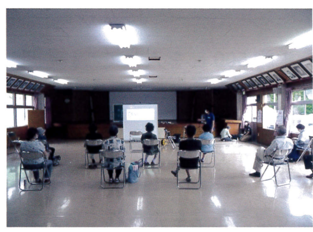
② 7月21日 代宿公民館 薬剤師の講話