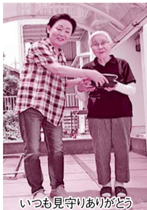
いつも見守りありがとうございます