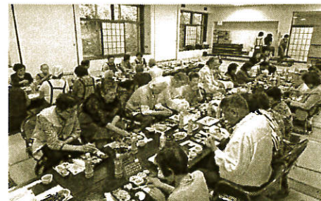
美味しいお弁当ありがとう！