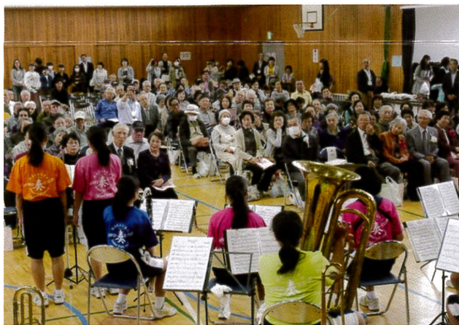
長浦中学校吹奏楽部の演奏