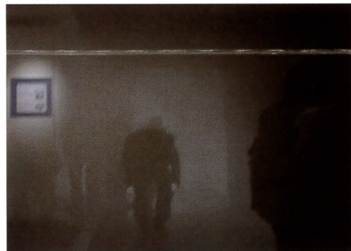
煙の中を脱出する恐怖体験

長浦地区社会福祉協議会は、「横浜市民防災センター」を訪問しました。毎年各地で突発的な自然災害が発生し、多くの犠牲者が出ています。「災害に強くなろう」がこのセンターの主題になっています。