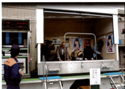
様々な揺れの恐怖体験