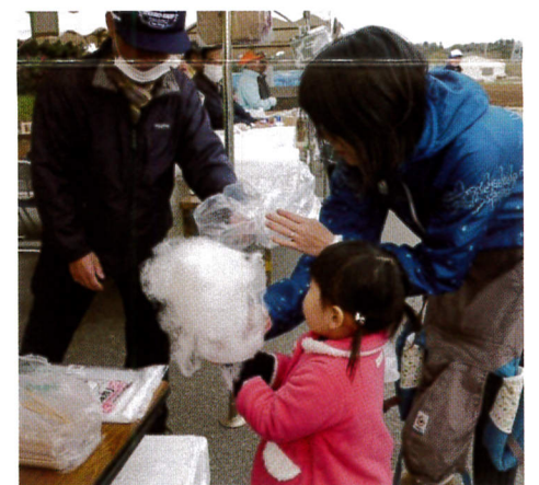
可愛いお客様、ご来店です

袖ヶ浦市地域福祉フェスタに、長浦地区社協も参加しました。PRブースにて、各事業部会の活動を写真を添えて展示し、来場の皆さんに見ていただきました。屋外テントでは、綿あめやフランクフルト等の出店販売をしました。《広報活動事業部会》