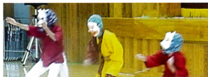
笑いを誘う“馬鹿囃子”の舞