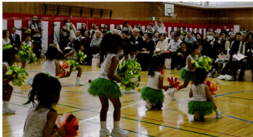
天使たちの演技に思わず笑みがこぼれます