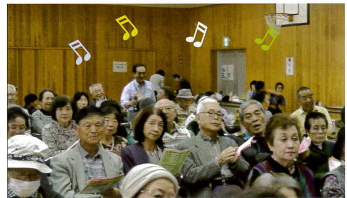
歌声が体育館内に響き渡りました