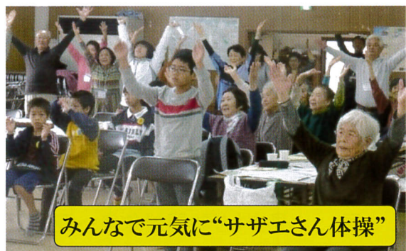
みんなで元気に“サザエさん体操”