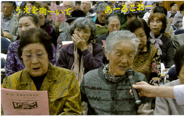
素敵な歌声 まだまだお若い

長浦中学校吹奏楽部の演奏、可愛い長浦エアロキッズのダンス、代宿太鼓保存会のひょうきんな馬鹿囃子等々を楽しんで頂きました。また、長浦公民館館長のエレキギターの伴奏で、会場全員で“上を向いて歩こう”の合唱で大変盛り上がりしました。初めての会場で、反省点もありましたが、次年度は更に楽しいものにしたいと思っております。 《高齢者事業部会》