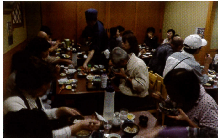
食べっぷりから、美味しさが伝わります

日頃出かける機会の少ないひとり暮らし高齢者を対象とした日帰りバスハイクで、歌舞伎座ととげ抜き地蔵の巣鴨に行きました。歌舞伎座では、観覧室から数分間歌舞伎鑑賞をし、ギャラリーで舞台装置や小道具を見学しました。 “おばあちゃんの原宿”こと「巣鴨地蔵通り商店街」では、お蕎麦屋さんで昼食を楽しんでからは自由行動でした。ここに来たら欠かせない“とげ抜き地蔵”にお参りし、願掛けする人が多かったようです。 《高齢者事業部会》