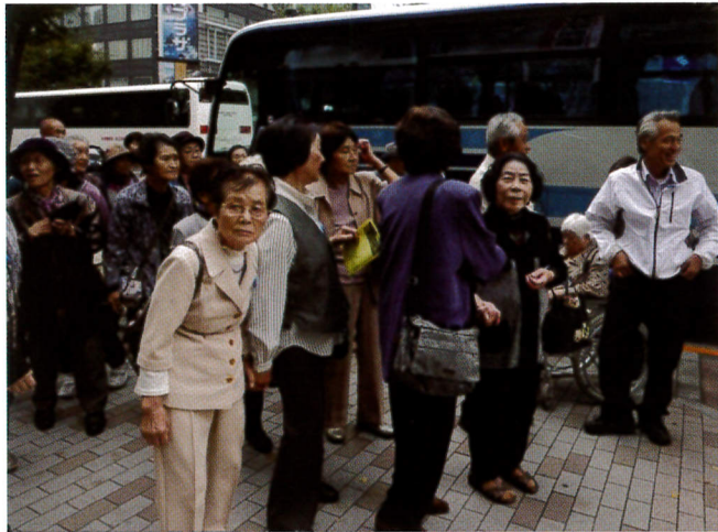
歌舞伎座、到着です