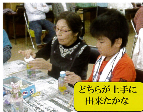
どちらが上手に 出来たかな