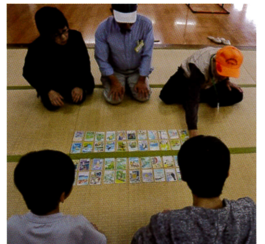
子ども vs 大人の真剣勝負(房総カルタ)