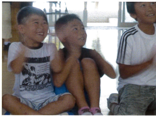
子ども達の笑顔、最高です