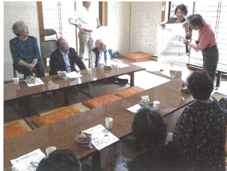
ゲームで頭の体操