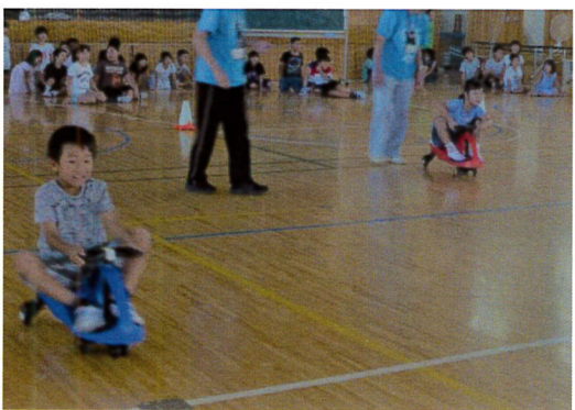
大人気のプラズマ・カーレース