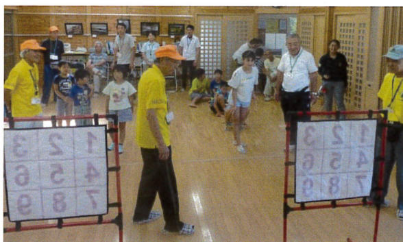
ボード当てゲーム(マジックナイン)