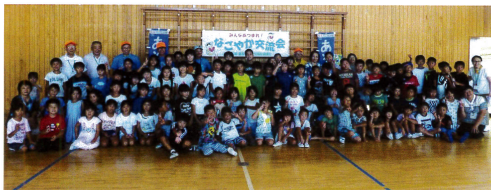
暑さを吹き飛ばす子ども達、2学期も頑張ってる

「みんなあつまれ」を旗印に、今年度も夏休み中に実施しました。7月31日、8月22日、8月24日の3回を予定し、準備をしたのですが、台風の影響で残念ながら1回は中止となりました。今年の夏は酷暑でしたので、子ども達の安全を第一に種目や休憩などみんなで話し合いました。