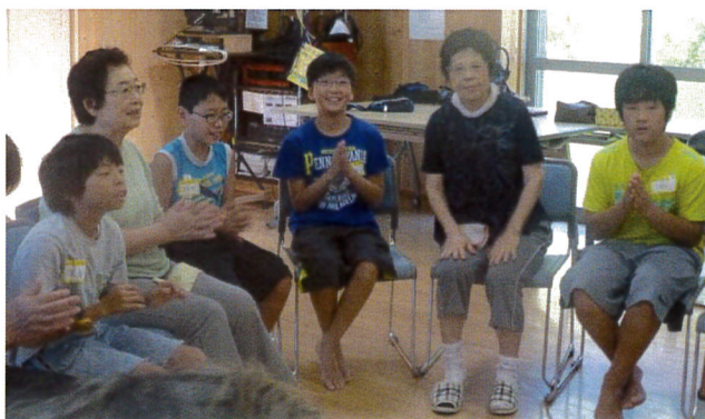
子ども達との交流、笑顔が溢れています