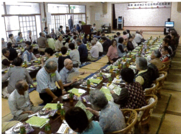
賑やかな昼食会でした