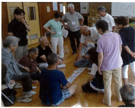
作った言葉をチェック中です