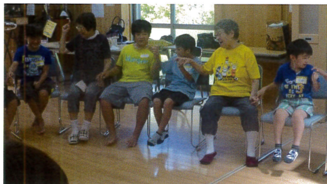
おばあちゃん達との楽しいゲーム

「なごやか交流会」には、もう一つお楽しみがあります。担当のスタッフが子ども達が喜んでくれそうなおやつを用意してくれます。今回は2回とも、スイカが大人気でした。次回は10月15日(月)長浦駅前自治会館です。皆さんもぜひ足をお運びください。《児童対応事業部会》