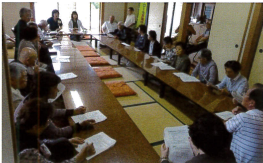
健康講座、皆さん真剣です