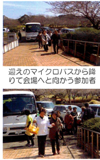
迎いのマイクロバスから降りて会場へと向かう参加者

お花見昼食会に参加された皆さんには、給食専門部会と給食ボランティアの皆さんが揃えてくれたお料理を食べてもらいながら、謡曲の踊りや唄等の演奏を楽しんでもらう事ができました。真室川音頭には、謡曲会の皆さんの真室川音頭には、会場から自然に手拍子や合唱する声が出て、本当に楽しい時間を過ごして頂くことができました。最後に、花のテラスの撮影に皆さんと記念写真を撮らせて頂きました。当日、送迎や会場準備等に協力して頂いた多くの皆様にお礼を申し上げます。