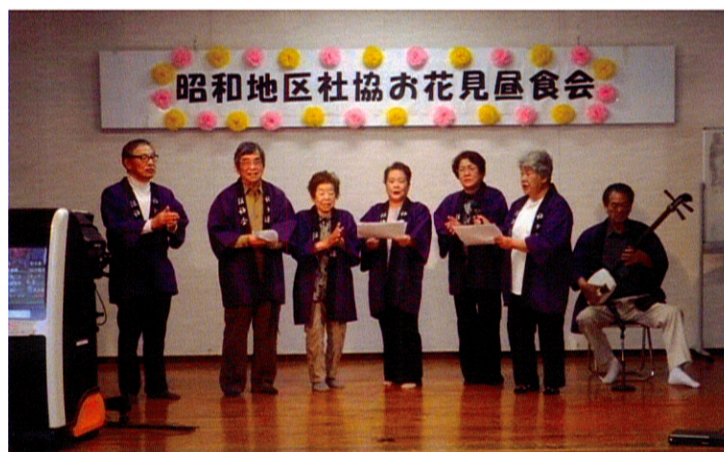
謡曲会の皆さんが唄う「真室川音頭」は爽快で、会場いっぱいになり響く手拍子と合唱する声で盛り上がる。