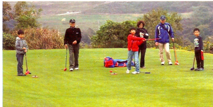
スナッグゴルフに参加した児童3名は大人顔負けの腕前!