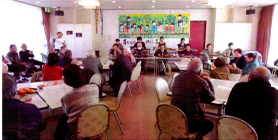
大正琴の伴奏でカラオケを楽しむ