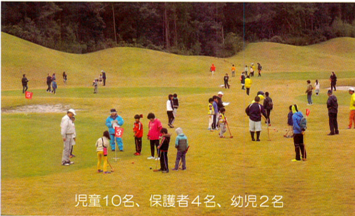
児童10名、保護者4名、幼児2名