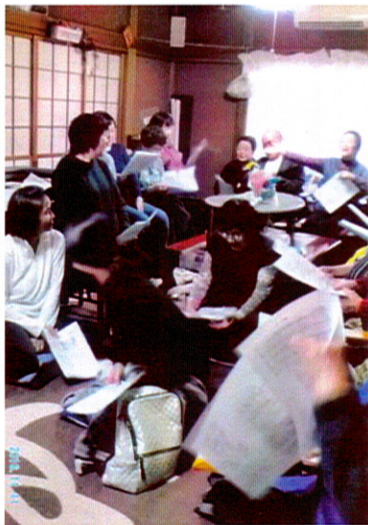
11月11日「みんなで歌おう」青空グループ