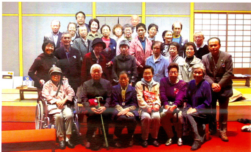
歌舞伎座ギャラリーに入場し、これから体験空間へ！