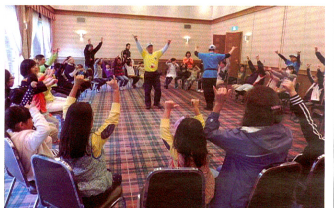
午前中、参加者全員で室内ゲームに興ずる

「ラダーゲッター」は、ボールを掛ける速さを競う記録にチャレンジして楽しむ遊び)などの楽しいゲームで若いも若きも、投げ