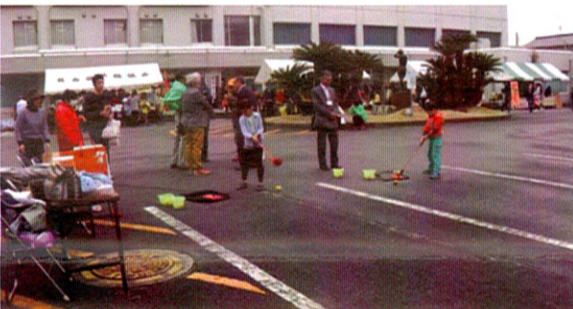
スナッグゴルフを楽しむ初体験の子供達

平成二十八年十一月二十七日 (日)、心配していた雨も降 ることなく、第九回袖ヶ浦市 福祉フェスタが開催されまし た。会場の平川公民館には親 子連れや若男女の皆様方が 大勢集まり、公民館前の広場 に出店された各地区の模擬店 の催しを楽しんでいただくこ とができました。