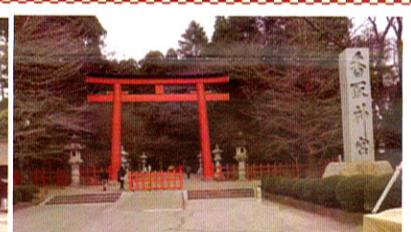
香取神宮の朱塗りの大鳥居