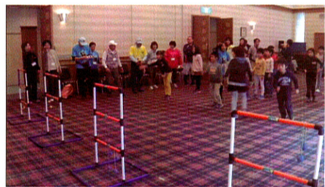
子供も大人もラダーゲッターに夢中

夏休みに計画した「わくわくチャレンジ2016」は、台風9号の直撃を受けやむなく中止となりましたが、開催を望む声があり、秋に再度計画しました。十月三十日、今回は会場をザ・カントリッククラブジャパンに移し、プログラムも変更して「わくわくチャレンジ2016 リベンジ秋の陣」と名付けました。 冷たい雨の朝でしたが、迎賓館を利用し、レク協会の皆さんとラダーゲッター(ラダーはしご)にボールを掛ける速さを競う記録にチャレンジして楽しむ遊び)などの楽しいゲームで若いも若きも、投げ るー走る! ゴールする! と大いに盛り上がり、日本記録への挑戦もしました。昼になるころ雨も上がったので練習場に場所を移し、スナッグゴルフ・スカイクロス・グラウンドゴルフの3種目をを行いました。参加者が少なかつたので、児童の家族やスタッフも皆競技に加わって、お互いの顔が見える楽しい会となりました。 今後とも地域の子どもたち、保護者の皆さんとつながっていただける活動が続けていきます。