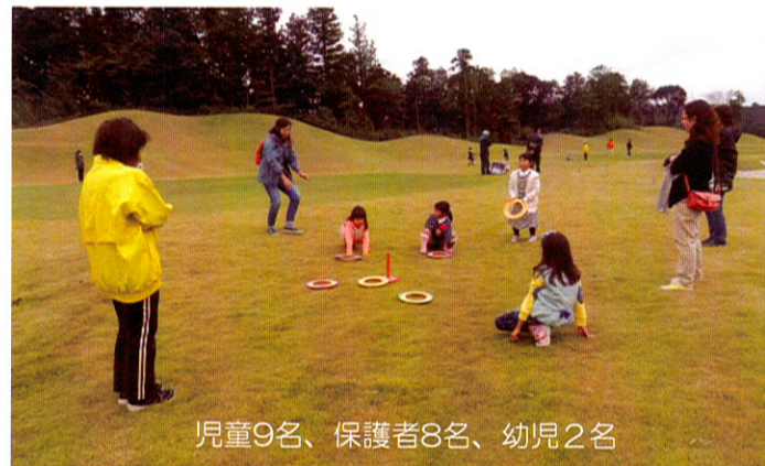
児童9名、保護者8名、幼児2名