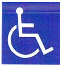
障害者のための国際シンボルマーク

御存知ですか? 障害者に関するマークについてご存知ですか。今回は左のマークを紹介いたします。 障害者が利用できる建物、施設であることを明確に表すための国際シンボルマークです。 マークの使用については国際リハビリテーション協会の「使用指針」により定められています。駐車場などこのマークを見かけた場合には、障害者の利用へ配慮をお願いいたします。