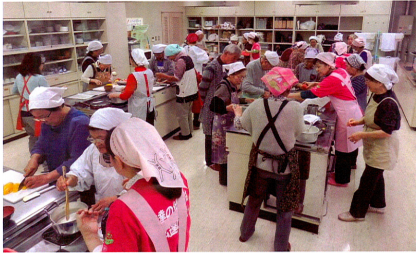
調理台に群がり、皆さん真剣に料理に取り組んでいました。

「無理なく減塩・カルシウムアップ料理」 ☆チキンピカタ ヨーグルトソースかけ ☆彩り野菜の甘酢漬け ☆白ごまプリン ☆ごはん