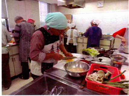
包丁さばきの鮮やかな男性陣に感心させられました。