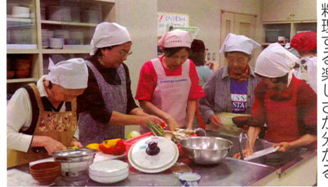
料理する楽しさが分かる