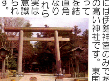
鹿島神宮の大鳥居

息栖神社の大鳥居 千葉県東部から茨城県東南部にかけて、「東国三社」と呼ばれる神宮二社、神社一社があります。正月三箇日の混雑時を避けて一月下旬に香取神宮(千葉県香取市)、鹿島神宮(茨城県鹿嶋市)、息栖神社(茨城県神栖市)の「東国三社参り」に出かけ、健康を祈願してきました。特に香取、鹿島の二神宮については、創建時に神宮と呼ばれたのは、他に伊勢神宮のみであり、格式の高い神宮です。東国三社は建つて三社を結ぶ場所を結ぶとほぼ直角三角形になり、これを「東国三社参り」の三社は実は富士山を意識して建てられました。