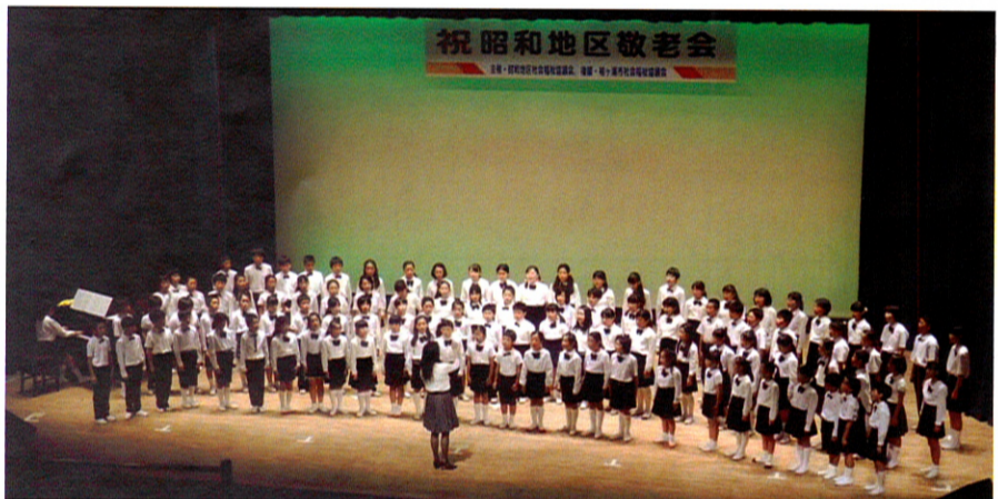
昭和小学校の合唱・メドレー「夏から秋へ」の歌声に癒されました

毎年、大正琴の演奏や舞踊、民謡、カラオケ等で来場者の皆さんを楽しませてくれる各団体の出演者の皆様方に心から感謝を申し上げます。また、主催者側役員の皆様、協力頂いた多くの方々、本当にお疲れさまでした。