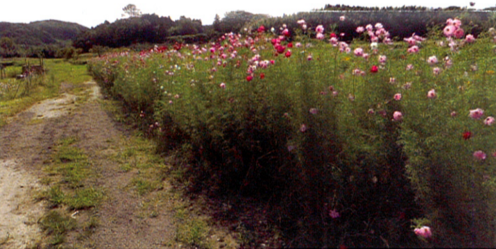
この地点からコスモスロードが続く

JR馬来田駅近くにある自然と歴史を探索しながらハイキングできる散策路「うまきたの路」へと久々に晴れた九月三十日に出かけました。駅から七百メートル先のうまきたの路起点から千四百年の歴史が息づく散策路がコスモスロードです。戦国時代にこの地に居城を構えた房総武田氏ゆかりの武田川に沿って歩き、水と緑を思う存分満喫できる散策道でした。