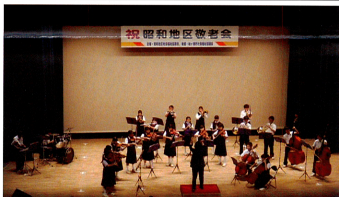
昭和中の管弦楽・365日の紙飛行機に聞き惚れる