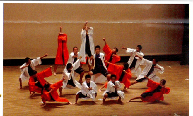
昭和中の演舞「ソーラン節」に圧倒されました