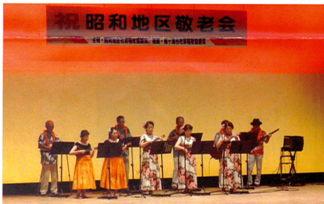
心も踊るハワイアン音楽を奏でるアロハリリース