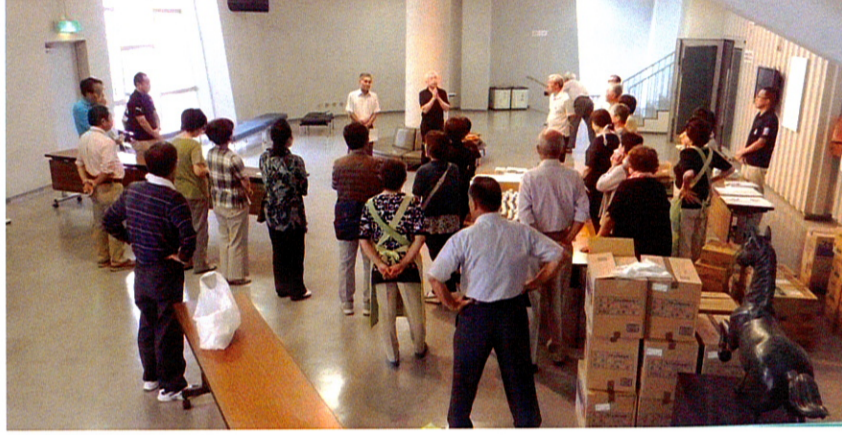
昭和三地区協の事業推進委員(含民生委員児童委員)及びボランティアの方々四十余名が9時に市民会館に集まり準備作業を始めます

昭和三地区敬老会は、主催・昭和三地区社会福祉協議会・後援・社会福祉法人袖ヶ浦市社会福祉協議会の下で開催されます。担当専門部会は昭和三地区協の高齢者専門部会です。敬老会事業は赤い羽根共同募金の助成を受け実施しています。