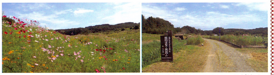
散策道の途中に一面に咲き乱れるコスモス