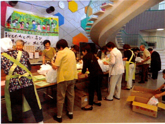
皆さんにお渡しする紅白饅頭等の袋詰作業は主に女性陣が担当します。