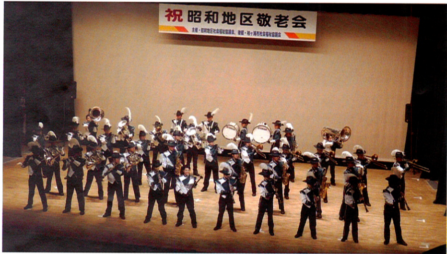
袖ヶ浦高校の勇壮なマーチングバンドの演奏に拍手大喝采でした

編集・発行 袖ヶ浦市昭和地区社会福祉協議会 広報専門部会 ☎ 0438-63-3888 〒299-0256 袖ヶ浦市飯富1604 袖ヶ浦市社会福祉センター内 FAX 0438-63-0825