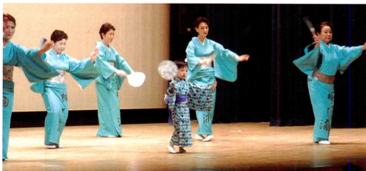
可愛い踊り手に微笑ましい拍手が！ 鳳扇会の皆さん