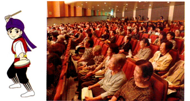
舞台の演技を楽しむ来場者の皆さん