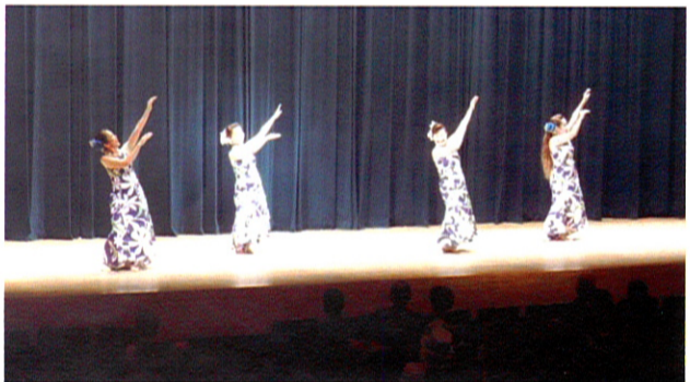
イリマ袖ヶ浦フラサークルの若々しいフラダンス