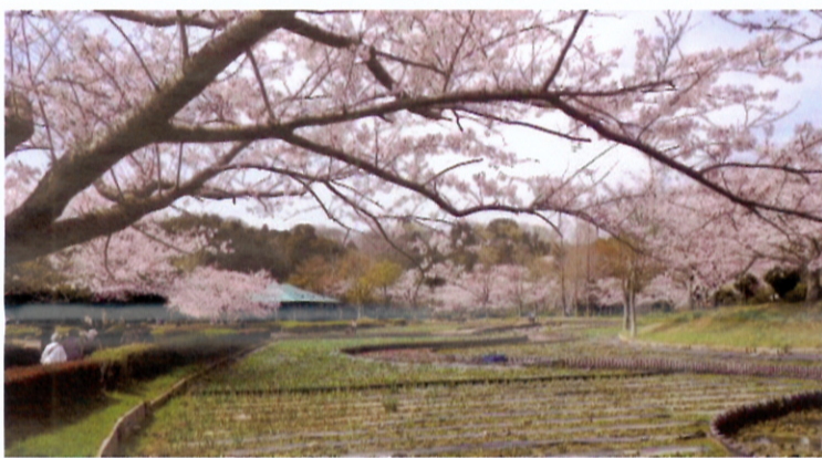
初夏になると菖蒲が咲き花いっぱいの公園となります