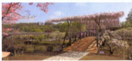
うす紅橋の藤棚は五分咲き(4/22)