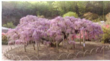
むらさき藤が見頃を迎える(4/22)