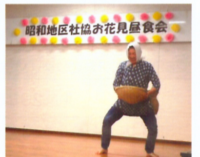
見事な安来節に大爆笑

平成二十八年四月六日(水)に恒例の「昭和数据社協お花見昼食会」が、袖ヶ浦公園内の老人福祉会館を会場として開催されました。一人暮らしの高齢者二十七名、昭和数据社協の主催者側スタッフ三十名の計五十七名が集い、給食専門部会のスタッフが準備した料理を味わい、皆様が演ずる各種余興で楽しい時間を過ごしていただくことができました。会場の大広間から見える満開の桜花は皆様の心を和ませ、眼を楽しませ、素晴らしいお花見昼食会となりました。