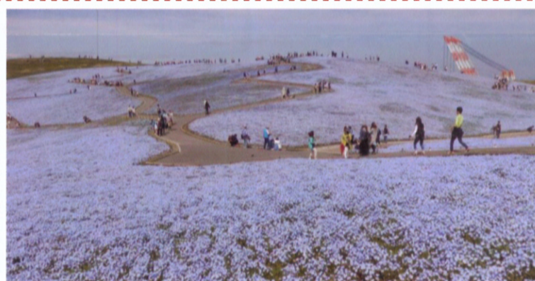
みはらしの丘に咲くネモヒラ