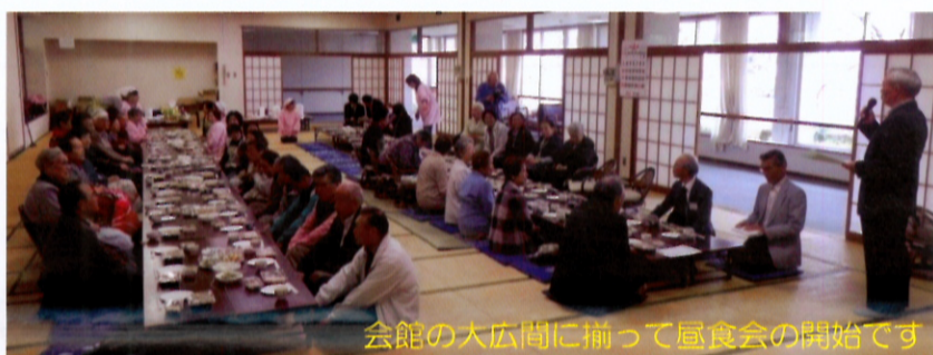
会館の大広間に揃って昼食会の開始です