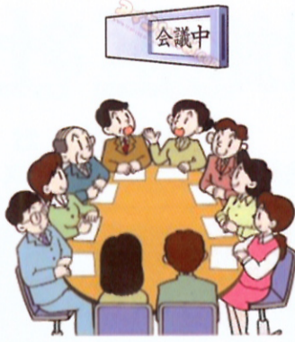
定期的に役員会議を開催しています。

実施事業としては九項目です。平成二八年度の単年度活動計画の予定表(下表参照)を作成して進捗管理をして推進する。