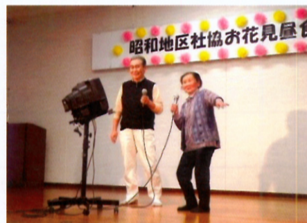
二人の息がピッタリのデュエット