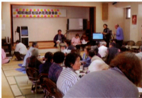
三味線に合わせて唄を披露!