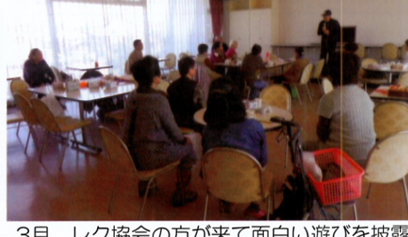
3月、レク協会の方が来て面白い遊びを披露

今年二月十八日(木)の開所日から毎月三十余名の方々が「サロンいきすこ」の会場に立ち寄られ楽しいひとときを過ごしていただいております。これからも楽しい企画を考えながら、長く皆様に親しまれる寄合所「サロンいきすこ」の運営を続けていきますので、皆様の温かいご支援ご協力をお願いいたします。