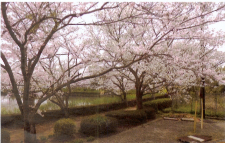
老人福祉会館沿いの池端に咲く満開の桜花