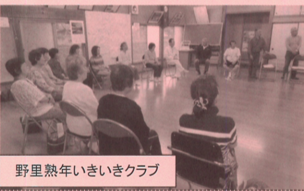
野里熟年いきいきクラブ

りました。六月七日には、十時から十二時に「野里熟年いきいきクラブ」が野里会館で開催され、二十一名の方が参加されました。袖ヶ浦市職員の百歳体操の説明があり、体操効果の動画に驚きの喚声をあげ、実技指導を受けました。その後、参加者全員で、次回からの百歳体操とサロンの進め方を相談し一回目を終了しました。