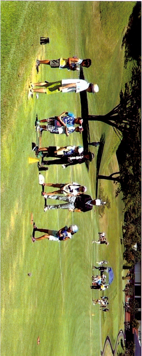
子ども達は、広いゴルフ場で初体験のヌックゴルフを大いに楽しむことができました