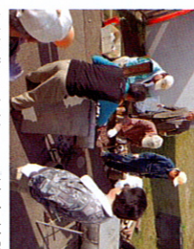
大繁盛で大忙しの焼き芋隊