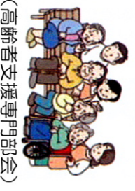
(高齢者支援専門部会)

開所してから毎月十名以上お集まり、楽しい時を過ごされていく。皆様が気軽に集まれる憩い所として二年になりました。