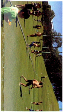
水玉合戦ではしゃぎ回る