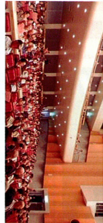
大勢の参加者が各種芸能を楽しみました

今年金婚式を迎えた方々が34組もいらっやいます。だことに、驚きと共に感動させられました。欠乏の夫婦揃っての記念撮影では、緊張やナシが可愛くもあり、素敵に寄り添っていただくことでも微笑ましく写っておりました。