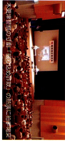
木更津警察の寸劇「嫉みのため詐欺」の熱演に拍手喝采