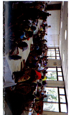
56名の児童が大集合