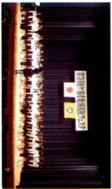
昭和小学校合唱部の発表