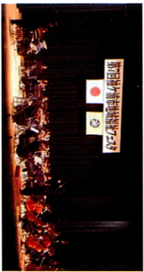
昭和中学校管弦楽部の演奏