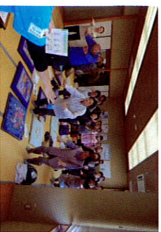
シニア料理教室開始前には健康体操について学ぶ。

骨を強くし、毎日元気に歩ける足腰を維持していくことが、明るい人生を過ごす上でとても大切なことになりました。そのためには毎日の食事内容が大切です。カルシウムに合わせたビタミンD・タンパク質・マグネシウム、ビタミンの栄養素を取り入れること、そして食塩やリン(加工食品に多く含まれています)の取り過ぎに注意することを学びました。