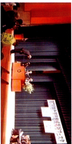
壇上で表彰状を受け取る