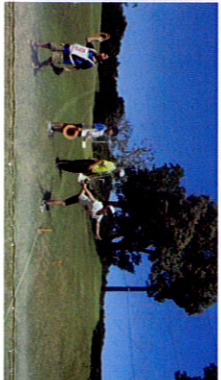
スカイクロスでゴルフ気分