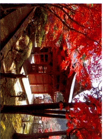
神野寺仁王門と紅葉