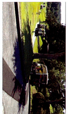
カートでゴルフ場を一周

広いコースをカートで回ればグリーンの上の実感もわくわくしている人々がかわせて呼ぶ。ゴルフはとっさう提供してくれることになり、そのやあでつかいシートが張れる。ウオーター先まで全身を濡らして涼をとる。今回は木更津ゴルフクラブのヌックゴルフを体験してもらいました。