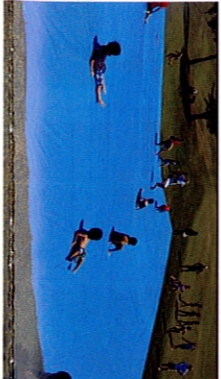
ウオーターライスター