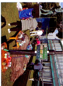
子供達にはお土産付きです