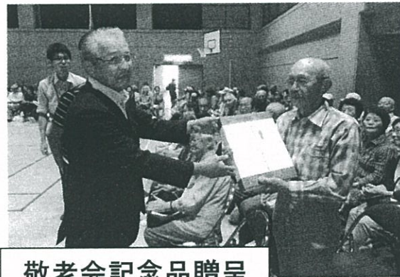
敬老会記念品贈呈

その後、袖ヶ浦市地域福祉計画(第2期) を市役所より、袖ヶ浦市地域福祉活動計 画(第3期)を袖ヶ浦市社会福祉協議会よ り説明があり、質疑応答を行って閉会 しました。