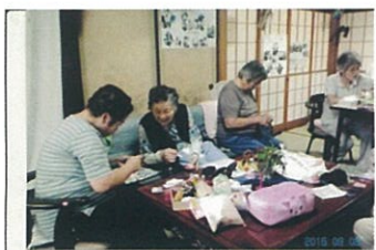
ハスの実作りを楽しむ皆さん

講師は「きらく」参加者の中からボランティアで指導してもらい、材料費だけで手作りの楽しさを満喫。お喋りしながら手先を動かし、出来上がり品に達成感の喜びを感じる。このままのきらくスタイルを継続したいと思っています。これからも気楽に集える場所としていきいきサロン「きらく」を可愛がっていただけるように願っております。