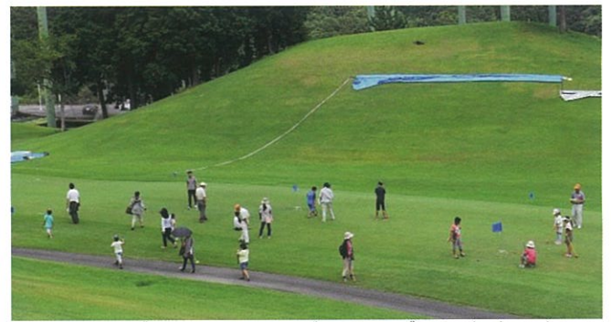
広いゴルフ場の中でグランドゴルフを楽しむ