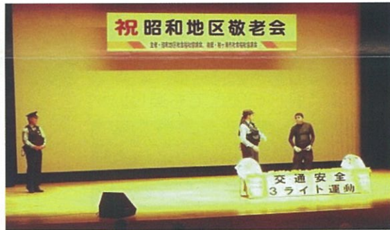
木更津警察地域課の寸劇「振り込め詐欺啓発」

振り込め詐欺の電話が、いつ自分の所にかかってくるかわかりません。電話の側に注意書を置くようにしましょう！