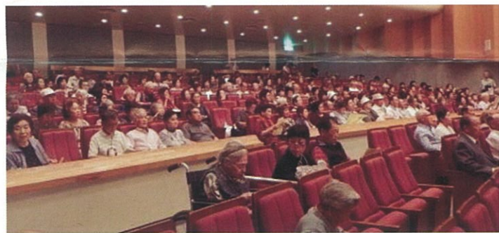
今年も大勢の来場者で会場が賑わいました