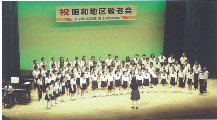
舞台上に整列した昭和小学校合唱部84名の美声に心を癒されました

今年、昭和小合唱部(八四名)、袖高音楽部(一七名)の皆さんの協力により出演して頂きました。 昭和小の皆さんの、透き通るような歌声に癒され、袖高生のバンド演奏に聞き入り、両校による合唱は迫力満点、会場の皆さんも一緒に歌って、とても和やかなひと時を過ごすことができました。