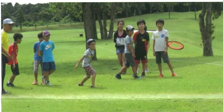
スカイクロスの輪は軽くてよく飛ぶのでとても楽しい