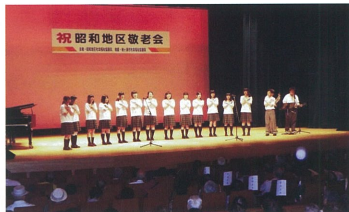
袖ヶ浦高校音楽部の迫力あるバンド演奏

今回金婚式を迎えられた方々は、二十六組。記念品と共に、ご夫婦の記念撮影、「結婚式以来だね。」と、出来上がった写真を手にとり、「綺麗に撮っていたいただき感謝します。」との言葉があり、主催側一同嬉しい気持ちでいっぱいでした。