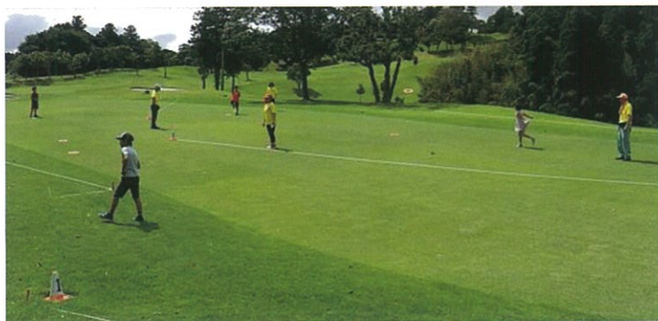
スカイクロスの輪が左端まで飛びました