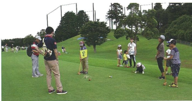
グランドゴルフ：ホールインを狙っています