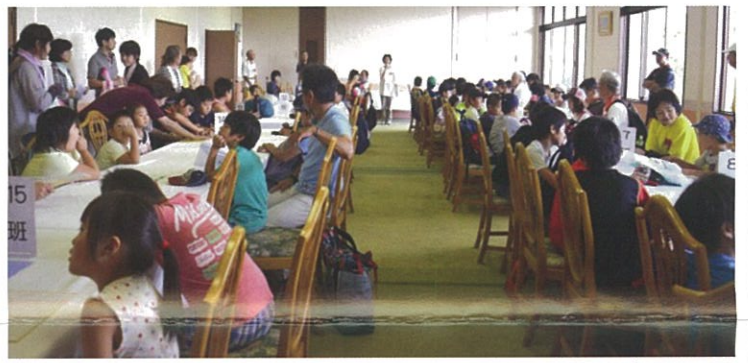
2階の部屋に全員集合し、各競技について説明を聞く