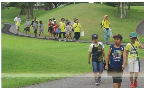
各競技の会場へと移動します