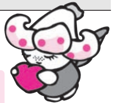
袖ヶ浦市ボランティアセンター イメージキャラクター「ゆりりい」