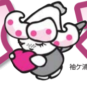
袖ヶ浦市ボランティアセンター イメージキャラクター 「ゆりりん」