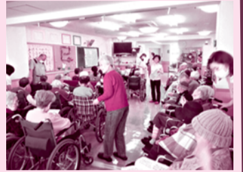
サニーヒルでの活動風景

活動について不安な方は、見学から始めませんか? 見学後に活動が決まったら、ボランティアセンターにボランティア登録をしていただいた後の活動になります。まずはボランティアセンターに、お電話ください。