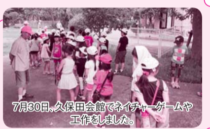
7月30日、久保田会館でネイチャーゲームや工作をしました。

対象 長浦・蔵波地区の児童及び保護者 内容 地域の親子や子どもたちと地域の大人が交流する場 ※ながうら青空の会と共催で実施しています。