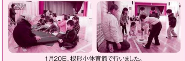
1月20日、根形小体育館で行いました。

根形地区社協は、平成24年度から3年間、根形小学校・根形中学校・袖ヶ浦高等学校とともに地域の福祉教育の推進に努める千葉県の「福祉教育推進指定」を受けて現在活動しています。 その一環として、根形地区社協事業推進委員が根形小1年生の昔遊び教室の先生として参加しました。房総カルタ、めんこ、けん玉、あやとり、お手玉、コマ回しで交流し、子どもたちは御礼にと元気に校歌を斉唱し、手作りのメダルをプレゼントしました。