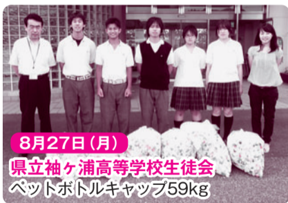
8月27日(月) 県立袖ヶ浦高等学校生徒会 ペットボトルキャップ59kg

暑い日差しが照りつける中、ボランティアセンターには多くの方からの収集物の寄贈がありました。皆様のあたたかい気持ちを、大切にさせていただきます。ありがとうございました。