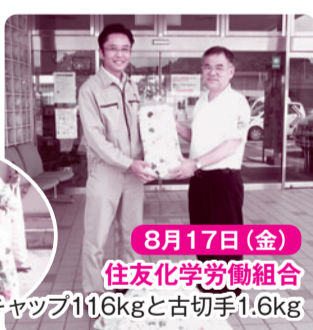
8月17日(金) 住友化学労働組合 ペットボトルキャップ116kgと古切手1.6kg

ペットボトルキャップはリサイクル業者で換金し、「世界の子どもにワクチンを日本委員会」に寄付しています。※ペットボトルキャップ約700gで、ワクチン1本が買えます。(BCGの場合)