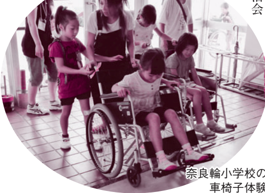
奈良輪小学校の車椅子体験

社会福祉協議会では、市内小中学校や自治会の方を対象に、車椅子やアイマスク、高齢者の体験を行う福祉教育を実施しています。体験した方からは、「何も見えないなかで階段を移動するのは怖かった」「歩いているときには気づかないほどの小さな段差に、車椅子では苦労した」「介助してくれる人を信頼することが大切だと感じた」という声が聞かれました。 さまざまな体験を通じて、障がいをもった方や高齢者だけでなく、家族や友達、近所の方など、そばにいる人の気持ちを常に思いやる気持ちを大切にしていこうと感じてほしいと考えています。