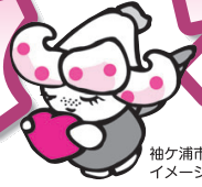
袖ヶ浦市ボランティアセンター イメージキャラクター「ゆりりい」