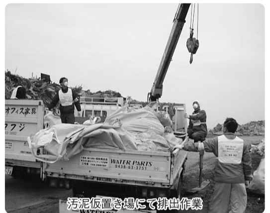
汚泥仮置き場にて排出作業

16人が無事に活動を終えて帰ってこられたのは、出発前の情報収集、石巻ボランティアセンターとの連携、各自が「袖ヶ浦の代表として来ている」という気概をもち自分の行動に責任を持って安全に心がけたこと、そして今回の活動にご支援・ご心配していただいた多数の皆様のお蔭であることから感謝しています。震災は決して他人事ではなく、私達一人一人が、今、もしここ袖ヶ浦