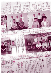
※昭和地区社協広報専門部会 作成:令和2年7月発行

内容：各地区社協の活動や地域の出来事などを掲載しています。地域の皆様に知ってもらい、顔の見える関係づくりを進めています。 ※各地区社協の広報部会員が記事を作成しています。