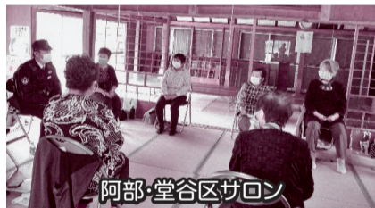
阿部・堂谷区サロン