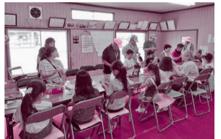
蔵波地区：7月30日今井青年館で折り紙などを楽しみました。 (写真は令和元年度開催のもの)