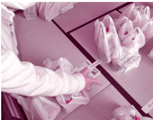
見守り訪問事業の準備の様子

対象：75歳以上のひとり暮らし高齢者及び80歳以上の夫婦のみ世帯(夫婦共に80歳以上) 内容：見守りを目的とし、月に1回各地区社協の事業推進委員(民生委員児童委員)が対象の方のご自宅を訪問しています。