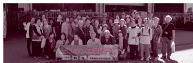
長浦地区：日帰りの小旅行を実施しています。毎年楽しみにされている参加者の方が多くいます。※開催時期や行き先は各地区で異なります。 (写真は令和元年度開催のもの)

対象：70歳以上のひとり暮らし高齢者 内容：年に1回、日帰り旅行を行い高齢者の交流を促進します。