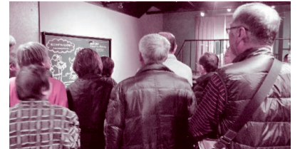
中富地区：東京都墨田区の本所防災館にて研修を行いました。台風被害の経験から定期的に防災意識を高める事の大切さを感じました。(写真は令和元年度開催のもの)

今年度は新型コロナウイルス感染症拡大防止のため、事業を中止しているものもあります。参加ご希望の方は事前にお問合せ願います。