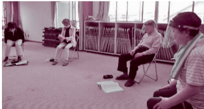
平岡地区：「滝ヶ沢さわやかサロン」 (場所：滝ヶ沢自治会館) 百歳体操やスポーツなど 和気あいあいと開催しています。 現在、コロナ禍のため参加者のマスク着用や検温、手指消毒を行い実施しています。 (※地区によって休止中のサロンもあります)

サロン活動は、仲間づくりの場、地域の皆さんの交流の場です。 外出の機会が少なくなりがちな高齢者が、サロンを通じて、交流を深めることで、住み慣れた地域の中で支え合い、安心して楽しく暮らしていくことを目指しています。