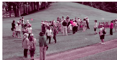
(写真は平成30年度開催のもの)

対象：昭和小、奈良輪小の児童及び保護者 内容：スナッグゴルフやグランドゴルフ等を通じ交流を深めるなど、子供と大人のふれあいの場をつくれます。