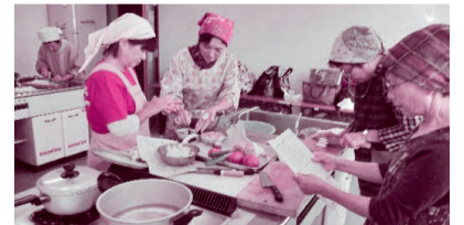
風味を活かし、薄味でもおいしく、栄養価満点!調理後は和気あいあいと皆で食事を楽しみました。 (写真は令和元年度開催のもの)

対象：70歳以上の高齢者 内容：高齢期の健康に必要な栄養について学び、調理実習を行います。