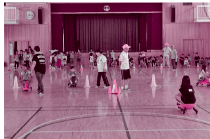
長浦地区：7月31日長浦小学校でプラズマカーレースなどを楽しみました。 (写真は令和元年度開催のもの)

対象：地区の児童及び保護者 内容：地域の子どもと大人が楽しいレク等を通じて世代間交流しています。 地域の親子がふれあう場、地域のつながりを築く場を目指しています。 ※ながうら青空の会と共催で実施しています。