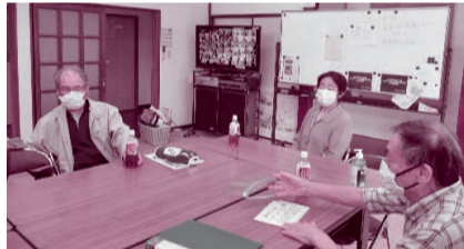
平岡地区：「サロンはなぶさ」 (場所：花房平自治会館) 百歳体操や困りごと相談、情報交換 DVD鑑賞などを行っています。