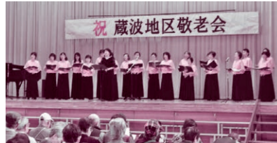
蔵波地区：小・中学校の合唱や演奏等で大いに盛り上がりました! (写真は平成30年度開催のもの)

対象：70歳以上の高齢者 内容：地域にお住まいの方のご長寿を地域のみみなでお祝いします。