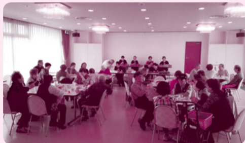
昭和地区「サロン いきすこ」(場所:市民会館) 毎月第3木曜日の午前10時~12時で開催しています。

いきいきサロンは、仲間づくりの場、地域の皆さんの交流の場です。 外出の機会が少なくなりがちの高齢者が、おしゃべりなどを楽しむ場(サロン)を通じて、地域の皆さんと交流を深めることで、住み慣れた地域の中で支え合い、安心して楽しく暮らしていくことを目指しています。簡単な体操やゲームをするなど、地区ごとに内容は異なります。