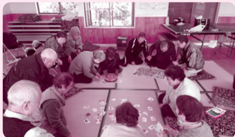
平岡地区「川原井よってけサロン」 (場所:川原井公会堂) 毎月第2水曜日(8月を除く)の午前10時~12時で開催しています。