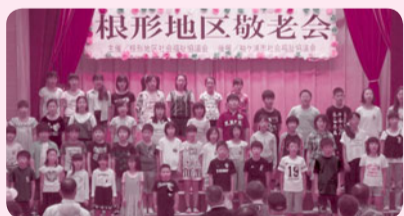
根形地区・根形小児童の皆さんが合唱を披露してくれました。

対象 70歳以上の高齢者 内容 お年寄りのご長寿をボランティアによる演芸や抽選会等でお祝いします。