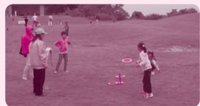
昭和地区・10月30日にザ・カントリークラブジャパンでめいっばい遊びました。

対象 昭和小・奈良輪小の児童及び保護者等 内容 スカイクロス・スナッグゴルフやレク等