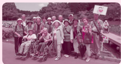
中富地区・年に1回の会食会で菖蒲を観賞しました。

対象 70歳以上のひとり暮らし高齢者 内容 月に1回、給食ボランティアが作ったお弁当を民生委員児童委員がお届けしています。