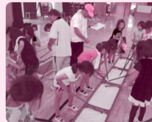
葦波地区・7月27日に今井青年館で実施し、房総こどもかるたなどを楽しみました。

対象 地区の児童及び保護者 内容 地域の親子がふれあう場・子どもと地域の大人が交流する場となるように楽しいゲーム等を実施しています。 ※ながうら青空の会と共催で実施しています。