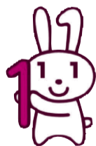
愛称:マイナちゃん