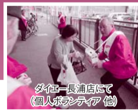
ダイエー長浦店にて(個人ボランティア 他)