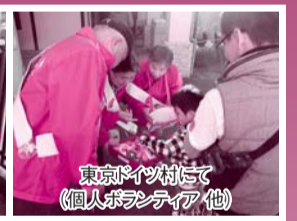
東京ドイツ村にて(個人ボランティア 他)