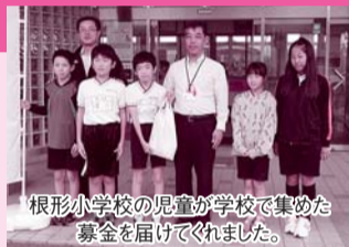
根形小学校の児童が学校で集めた募金を届けてくれました。