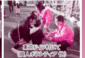
東京ドイツ村にて(個人ボランティア 他)