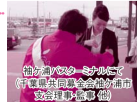
袖ケ浦バスターミナルにて(千葉県共同募金会袖ケ浦市支会理事・監事 他)